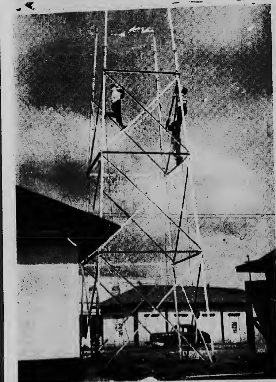
Hier ziet men de oude zendmast naast Landradiodienst onder de handen van de slopers. Meer dan 20 jaar trouwe dienst vond zijn einde.

NEW YORK.— Thomas Dewey heeft zich te New York als advocaat gevestigd na 24 jaar in overheidsdienst te zijn geweest, waarvan 12 jaar gouverneur van de staat New York. Twaalf jaar gouverneur zijn is te lang, zij hij, het is een wonderlijk gevoel om geen zestien miljoen bazen meer te hebben.